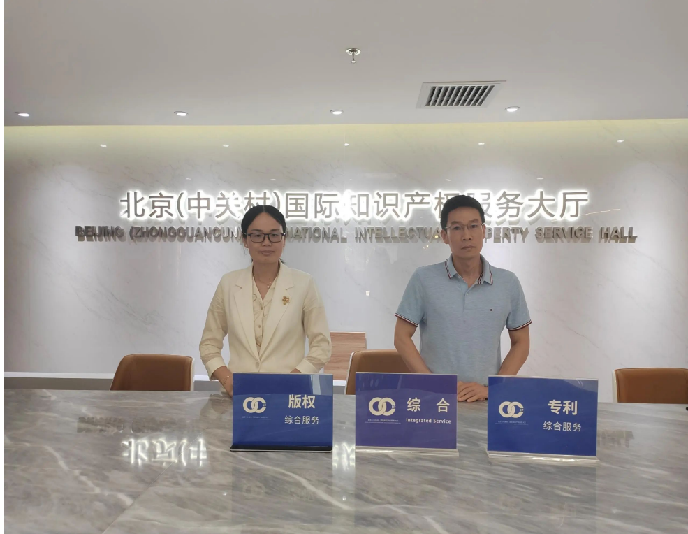
(付治律师、关跃律师)