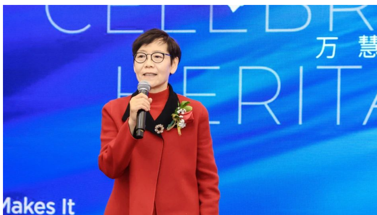
嘉宾茅榕律师 介绍与万慧达合作经历