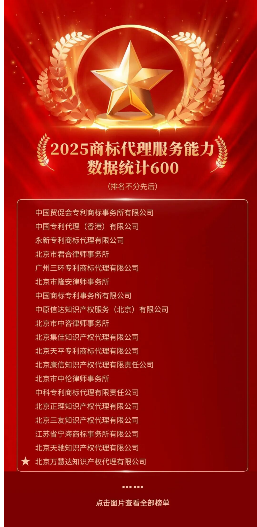
2025商标代理机构服务能力数据统计600